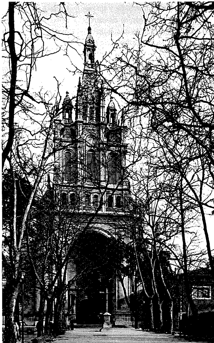
Basilica de Nuestra Señora de Begoña.