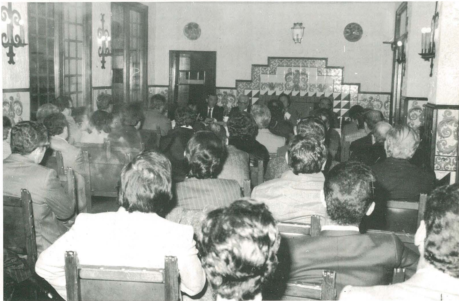
Un aspecto de la Asamblea celebrada en Barcelona.

Como ha dicho el Papa: "La fé es del Pueblo".