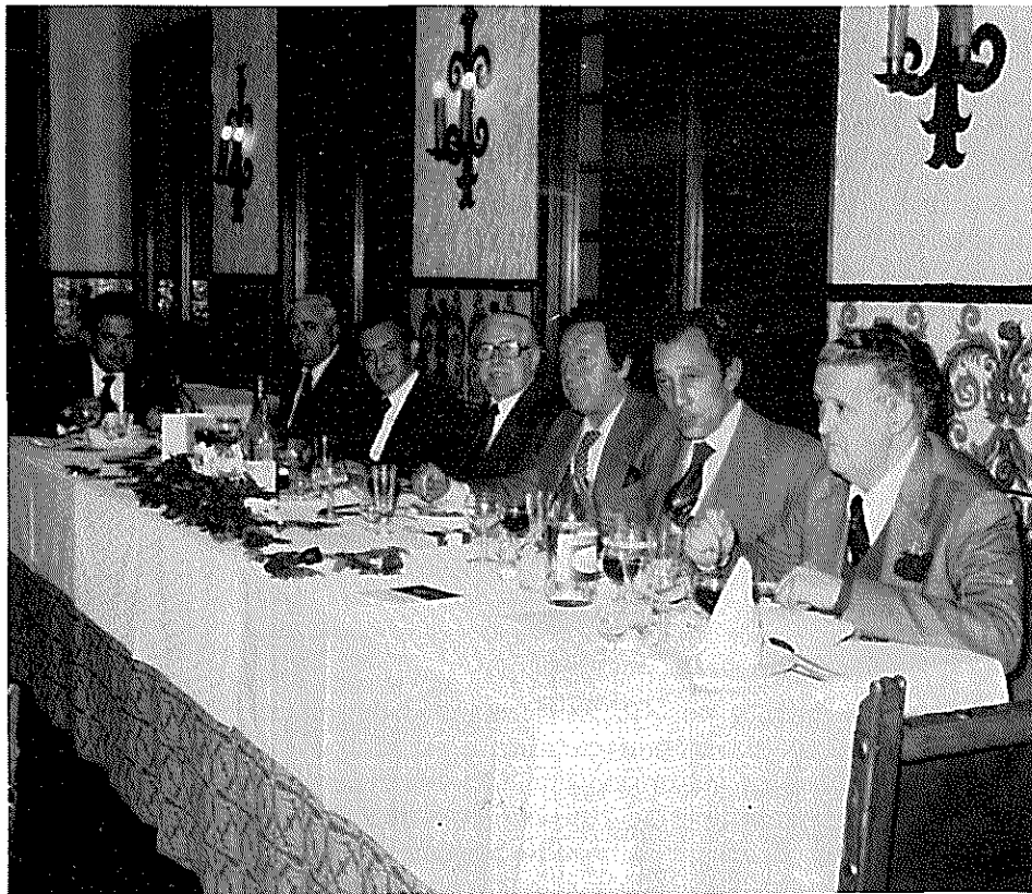
Presidencia de la Cena de Hermandad.

Sería aconsejable dar a conocer el contenido de las conferencias, a fin de mantener, entre ambas entidades, contactos personales y de estudios doctrinales.